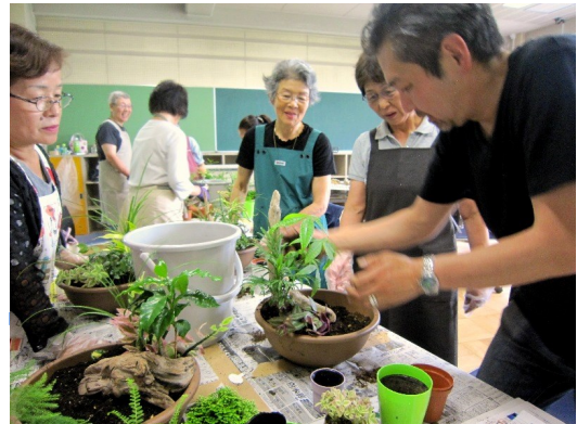
*↑観葉植物の講座写真